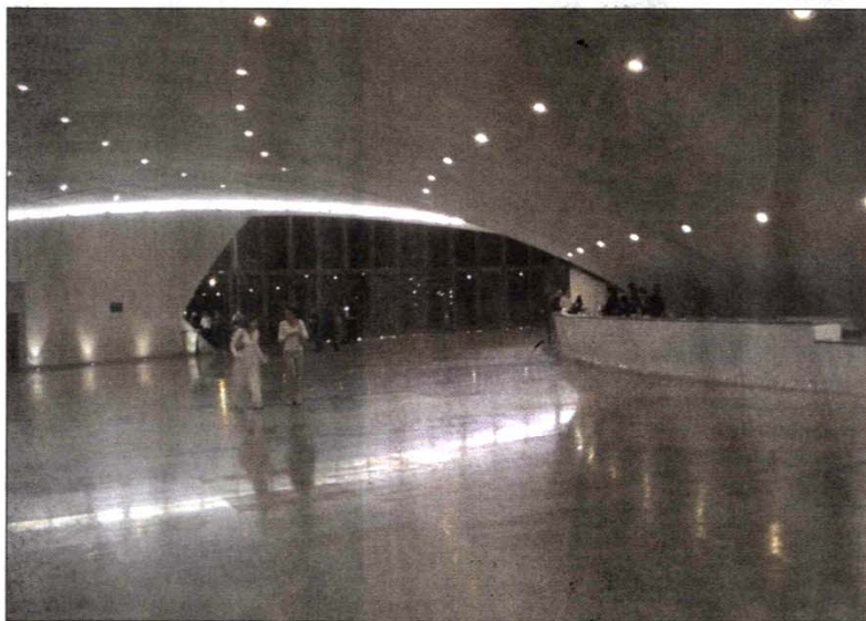
BØLGE. Det nye musik- og operahus på Tenerife tegner en markant profil i hvid beton beklædt med kakkelstykker, der skaber en glat poleret overflade. En af husets skaller rejser sig i en markant bue, der minder om en kæmpemæssig bølge, der løber sig ind over koncertsalen. Bølgen når en højde på 60 meter, inden den bøjer og ender i en spids.

kompositioner fremstår som neoeexpressionistiske monumenter løsrivet fra tid og sted, men markante og opsigtsvækkende i deres udtryk. Med Auditorio de Tenerife har Calatrava tilføjet et musik- og operahus til sine omfattende meritter verden over.